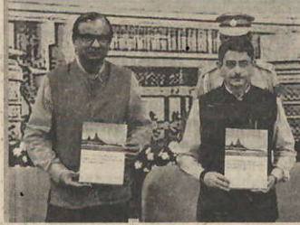
Governor RN Ravi at a conclave in IIM Tiruchy on Saturday