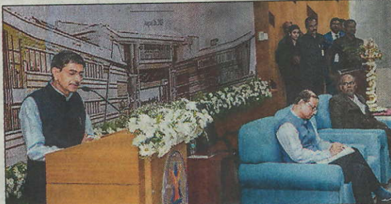
SHARING THOUGHTS: Governor R N Ravi addresses students at a conclave at IIM Trichy on Saturday