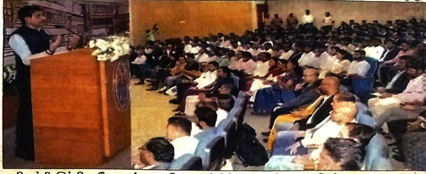
திருச்சி இந்திய மேலாண்மை நிறுவனத்தில் (ஐ.ஐ.எம்.) நடைபெற்ற தலைமை பண்பு குறித்த கருத்தரங்கில் கவர்னர் ஆர்.என்.ரவி பேசிய போது எடுத்தபடம்.

ஊழலை ஒழிக்க டிஜிட்டல் இந்தியா திட்டத்தை உருவாக்கினார்: